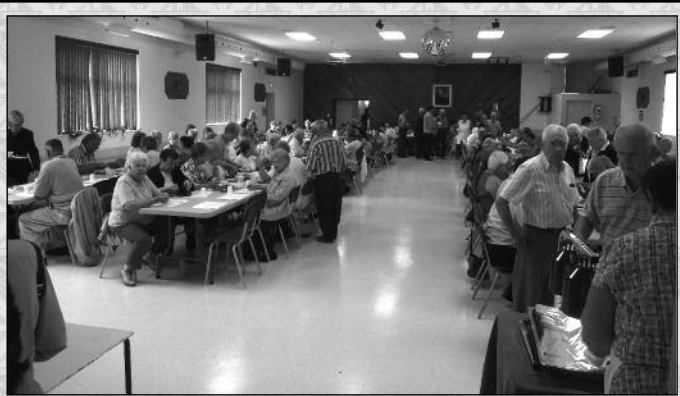
PARTICIPANTS LORS DE NOTRE DÉJEUNER DE SEPTEMBRE 2011