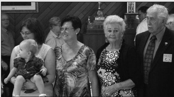
4IÈME GÉNÉRATION DE FILLES