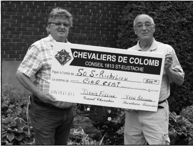
DON S.O.S RICHELIEU 500$