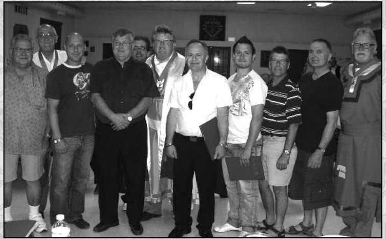
NOS NOUVEAUX MEMBRES