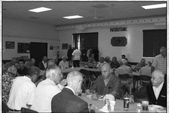
SOUPER DE FIN D'ANNÉE